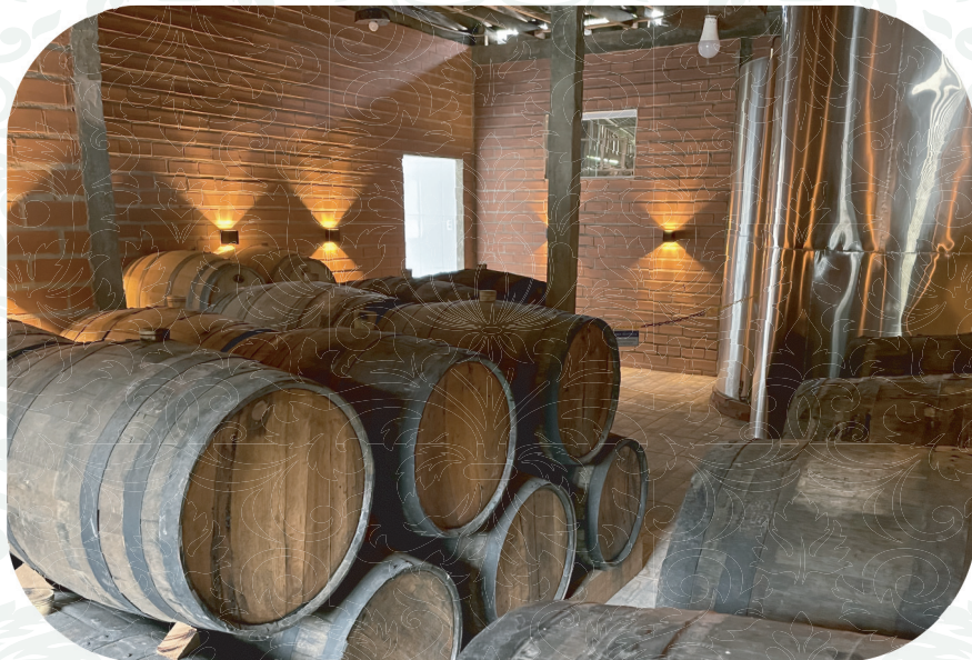
Envelhecimento em barris de 200L.