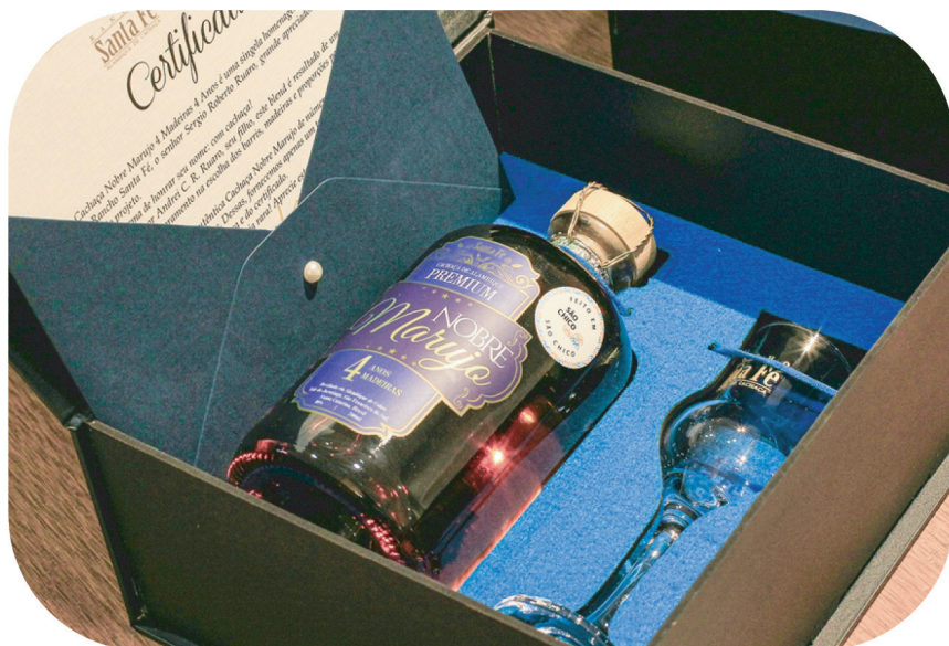
Nobre Marujo 4 Anos garrafa Número 001.