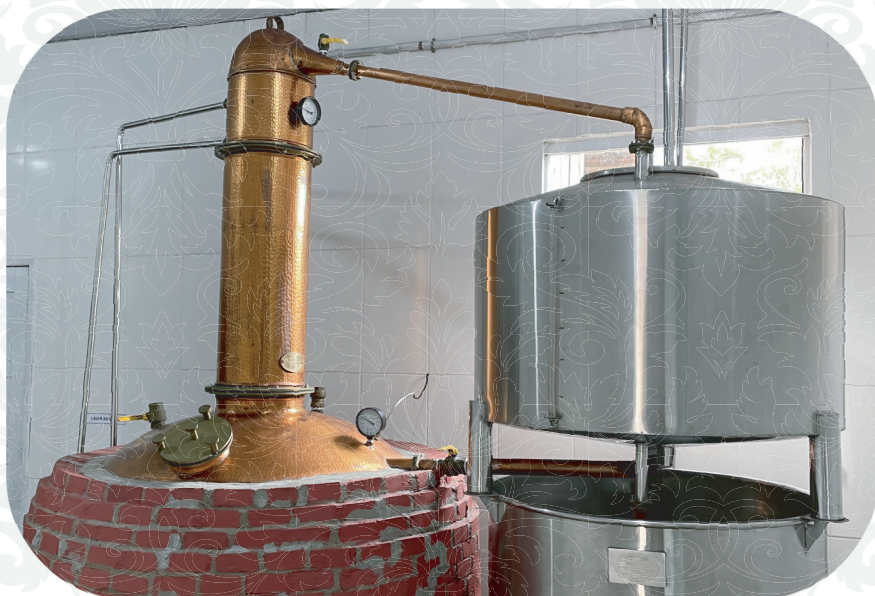
Destilação em alambique de cobre.