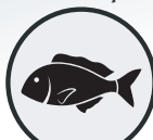
PEIXES, PETISCOS, FRUTOS DO MAR